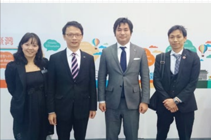
1/10.11 台北にて打合せ (台北訪問)